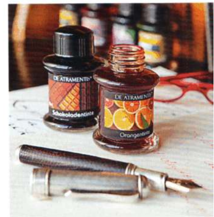
Geschmackssachen: Die Tinten duften selbst aus dem Füller.

Verschrieben hat sich der 60-Jährige vor allem der Suche nach alten Rezepten und der Herstellung ausgefallener Tinten für heutige Füllhalter. Denn selten taugen die historischen Rezepte für moderne Schreibgeräte. Wer möchte schon einen Liebesbrief mit einer originalgetreuen Mischung aus Wein und Knabenurin zu Papier bringen? Oder vor der ersten Zeile mühsam Schlehenrinde („kurz vor dem Ausschlagen im Mai“) zu rotbrauner Brühe verkochen, mit Wein versetzen, mit Baumharz verdicken und im Pergamentsäckchen an der Sonne trocknen lassen?